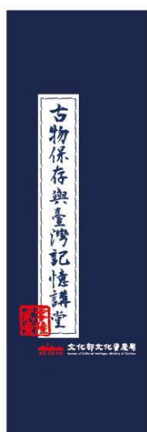
古物講堂帆布提袋

*參加講堂活動送講堂「專屬深藍古籍意象厚帆布提袋」好禮喔，讓珍貴之古物與文化走入你我生活當中，變成生活之一部分。