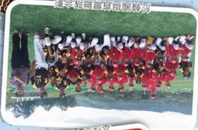
於韓國與首爾聯隊合影