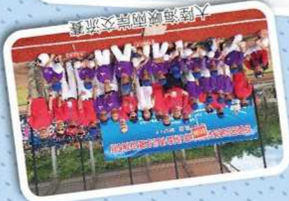
大陸海峽兩岸交流賽