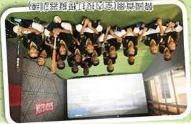
韓國首爾(室內投打模擬器訓練) 韓國首爾台韓交流賽

第一梯次已經額滿！感謝支持，現在開放第二梯次報名！！ 線上報名優先，依報名時間錄取前50名。 線上報名若未滿50人，開放現場報名。