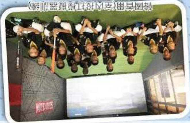
韓國首爾(室內投打模擬器訓練)