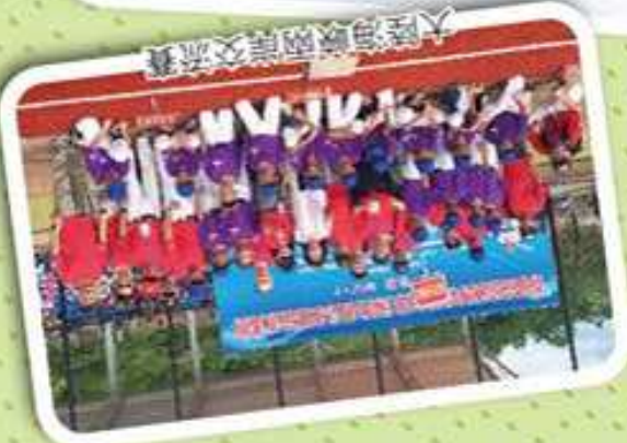
大陸海峽兩岸交流賽