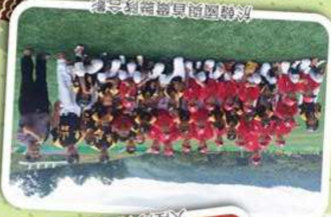
於韓國與首爾聯隊合影