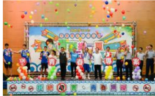
圖 24 青春專案起跑暨校園反毒宣導活動