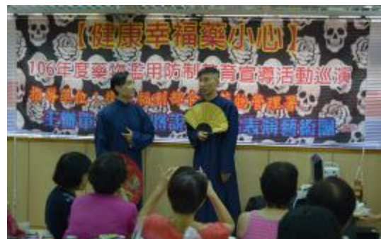
圖 36 笑將說學逗唱相聲表演

(8) 為營造健康無毒職場環境，運用企業熟悉的 P-D-C-A 管理工具，於 36 家企業內部推動藥物濫用防制相關活動，總計 21 場次，4,426 人次參加。