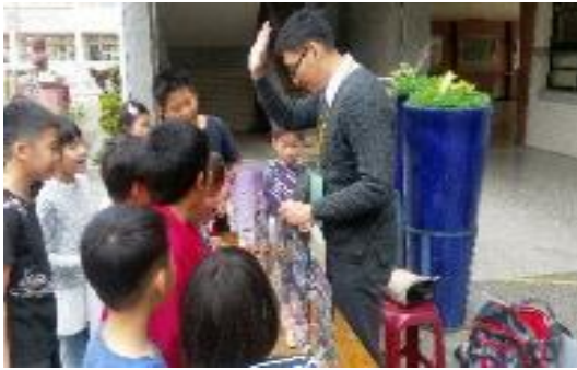
圖 48 校園仿真毒品巡迴列車