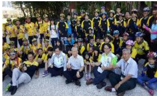
圖 56 桃園市長為高關懷學生自行車環島打氣鼓勵