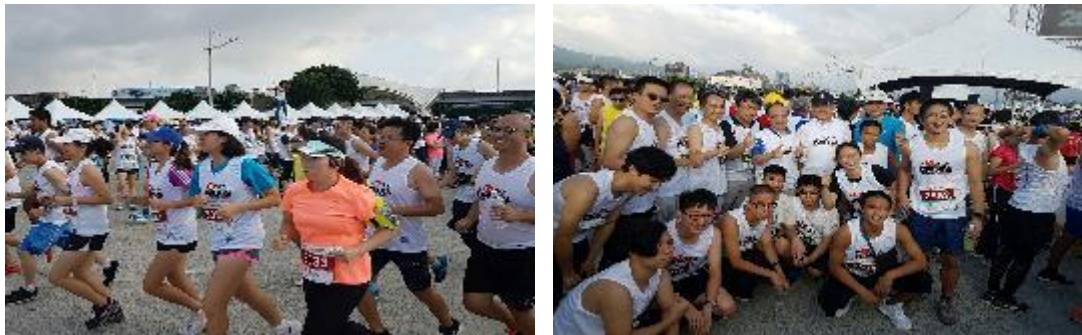
圖 52 臺北市政府與國際扶輪社合辦反毒路跑活動