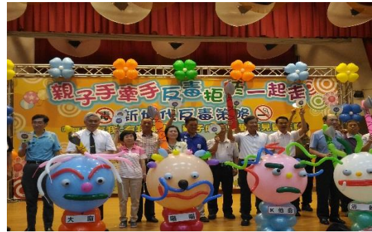
圖 59 親子成長暨觀摩見習(基隆市)