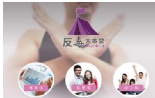
圖 31 「反毒大本營」網站入站畫面