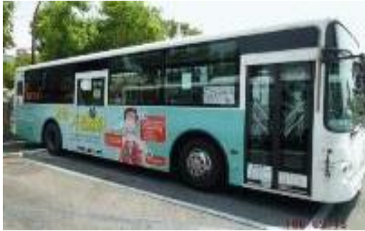
圖 33 「青春 不惹麻煩」公車車體宣導

(7) 106 年共結合 25 個民間團體，以寓教於樂方式，包括相聲、舞蹈、話劇、授課、大型活動等，吸引青少年及民眾參與，藉此強化民眾拒毒意念與認知；總計辦理 1,566 場次宣導活動，受益人次約 27 萬 0,304 人次。(圖 36)