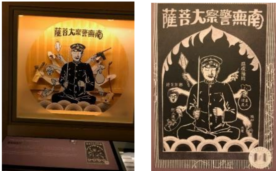
圖 10 「斯土斯民：臺灣的故事」常設展「鉅變與新秩序」