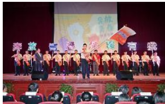
圖 21 替代役公益大使團