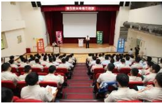
圖 20 替代役反毒種子培訓