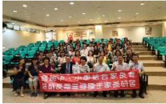
圖 49 結合家長會培訓反毒宣導種子家長入班宣導