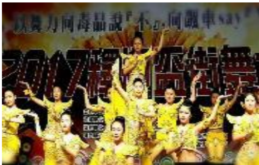
圖 64 結合「釋迦功德會」辦理反毒反飆車舞蹈大賽