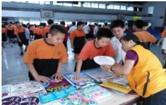
圖 46 春暉志工於新泰國小實施反毒設攤宣導

持續辦理各級學校「加強教育人員反毒知能研習」、「防制學生藥物濫用校園宣講」、「運用班會時間收視反毒動畫或微電影及春暉認輔志工入校設攤實施反毒宣導等活動，106 年度迄今辦理各類研習及宣導活動計 483 餘場次，約 14 萬餘人次參加。(圖 46、47)