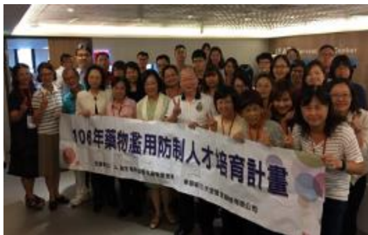
圖 35 藥物濫用防制人才培育課程 (北區)