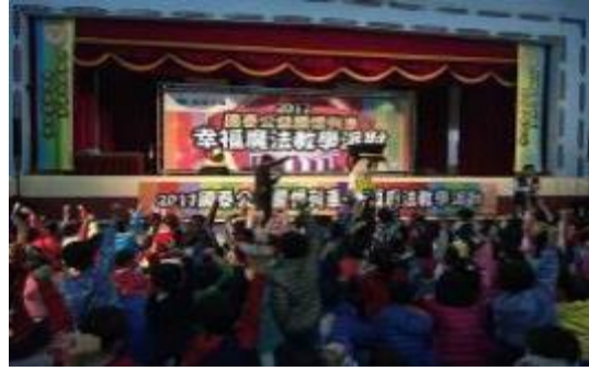
圖 29 幸福魔法教學派對