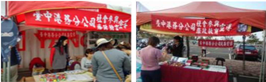
圖37「微笑港灣反菸拒檳毒-安全健康齊步」健康安全週活動