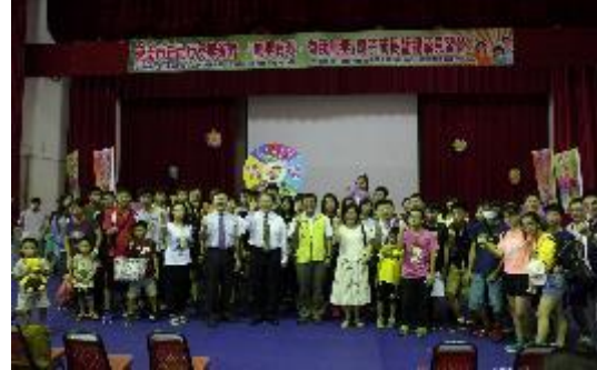
圖51無毒有我我無毒反毒教育親子營