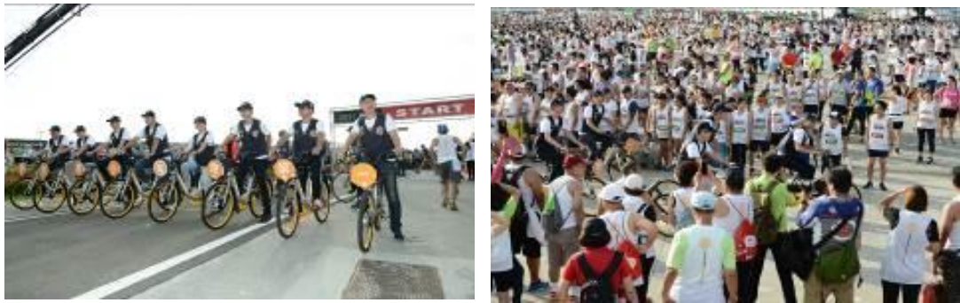
圖 27 萬人反毒公益路跑