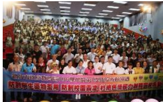
圖 47 朱市長主持「友善校園 - 響應毒品零容忍」宣示活動