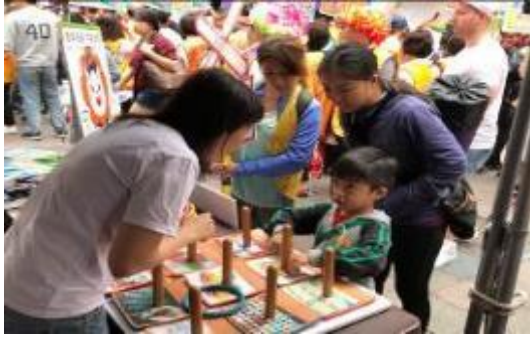
圖 28 反毒反酒駕熱舞、百年快樂 服務獅友總動員