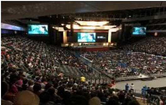
圖 23 「勇敢的心」反毒電影撥放