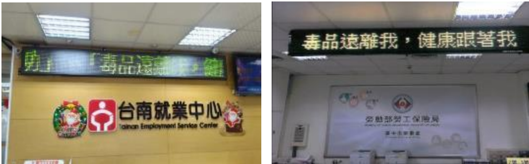
圖 19 勞動力發展署及勞工保險局運用跑馬燈進行反毒宣導