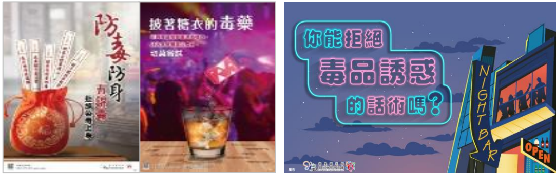
圖 32 拒毒宣導海報及懶人包